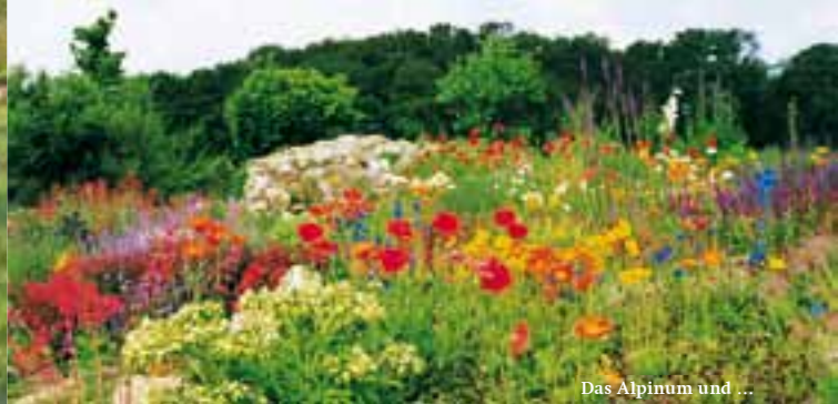
Das Alpinum und ...