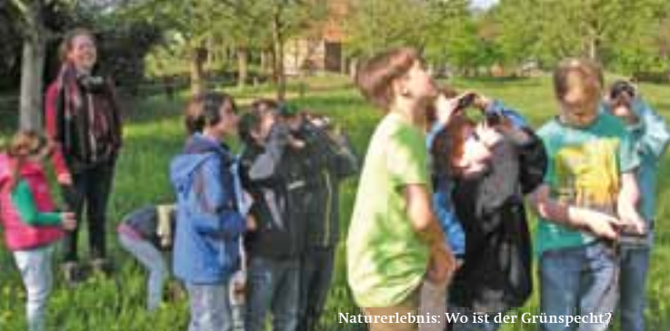
Naturerlebnis: Wo ist der Grünspecht?