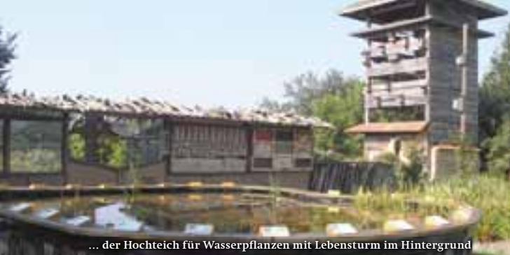
... der Hochteich für Wasserpflanzen mit Lebensturm im Hintergrund