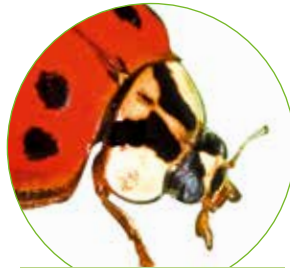
„W“ auf dem Kopfschild